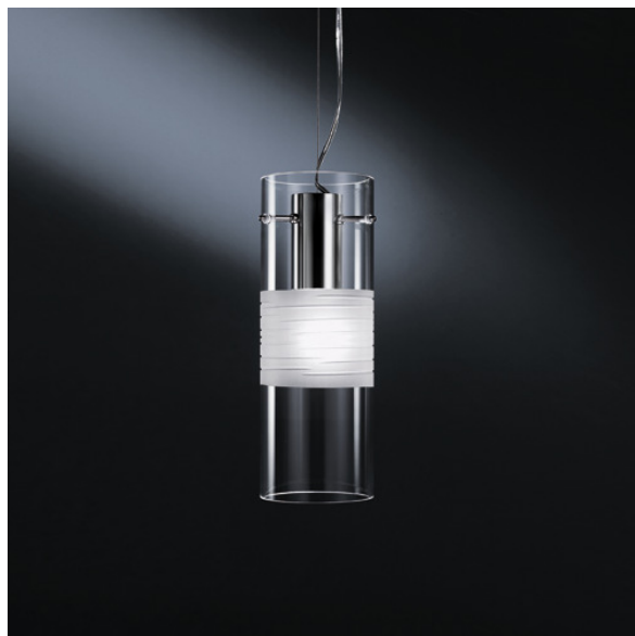
OXILOOS10/11 XILO S10 sospensione